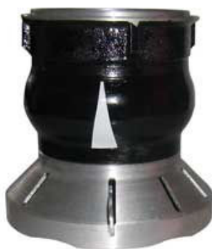
Sací koš Profi II