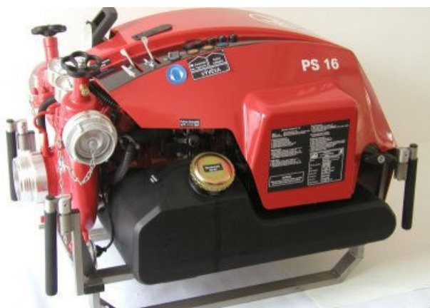
Přenosná stříkačka PFPN 10-1500