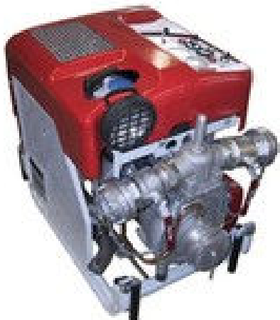
Přenosná motorová stříkačka PFPN 10-1000 KOMFI