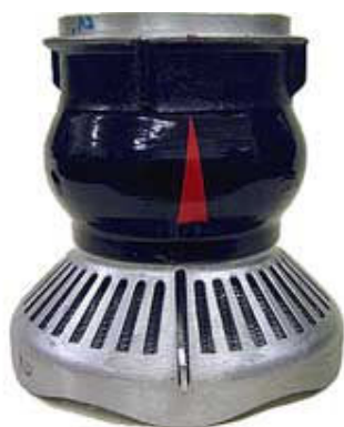
Sací koš Profi I