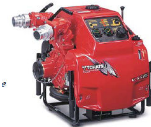
Přenosná motorová stříkačka Tohatsu VC85BS